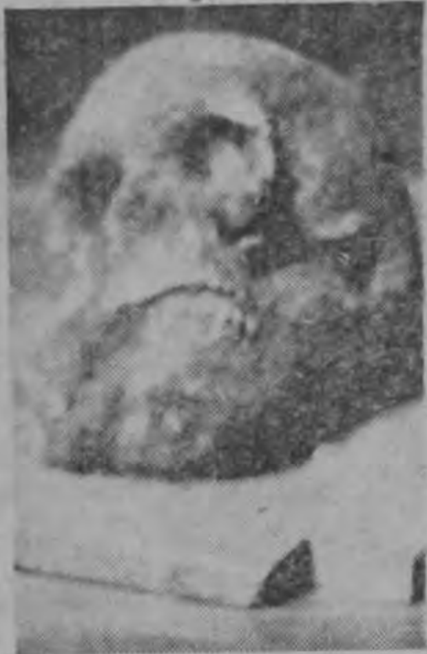
Cráneo hallado en las tumbas

Aprovechamos esta oportunidad para expresar nuestro reconocimiento a los estudiantes y a los profesores, quienes en forma desinteresada se preocupan por la Arqueología de nuestros aborígenes, la cual actualmente parece que ha degenerado en una industria para los "huaqueros", quienes destruyen los vestigios de la cultura de nuestros antepasados, únicamente con el fin de conseguir el oro, o los objetos vendibles a los turistas.