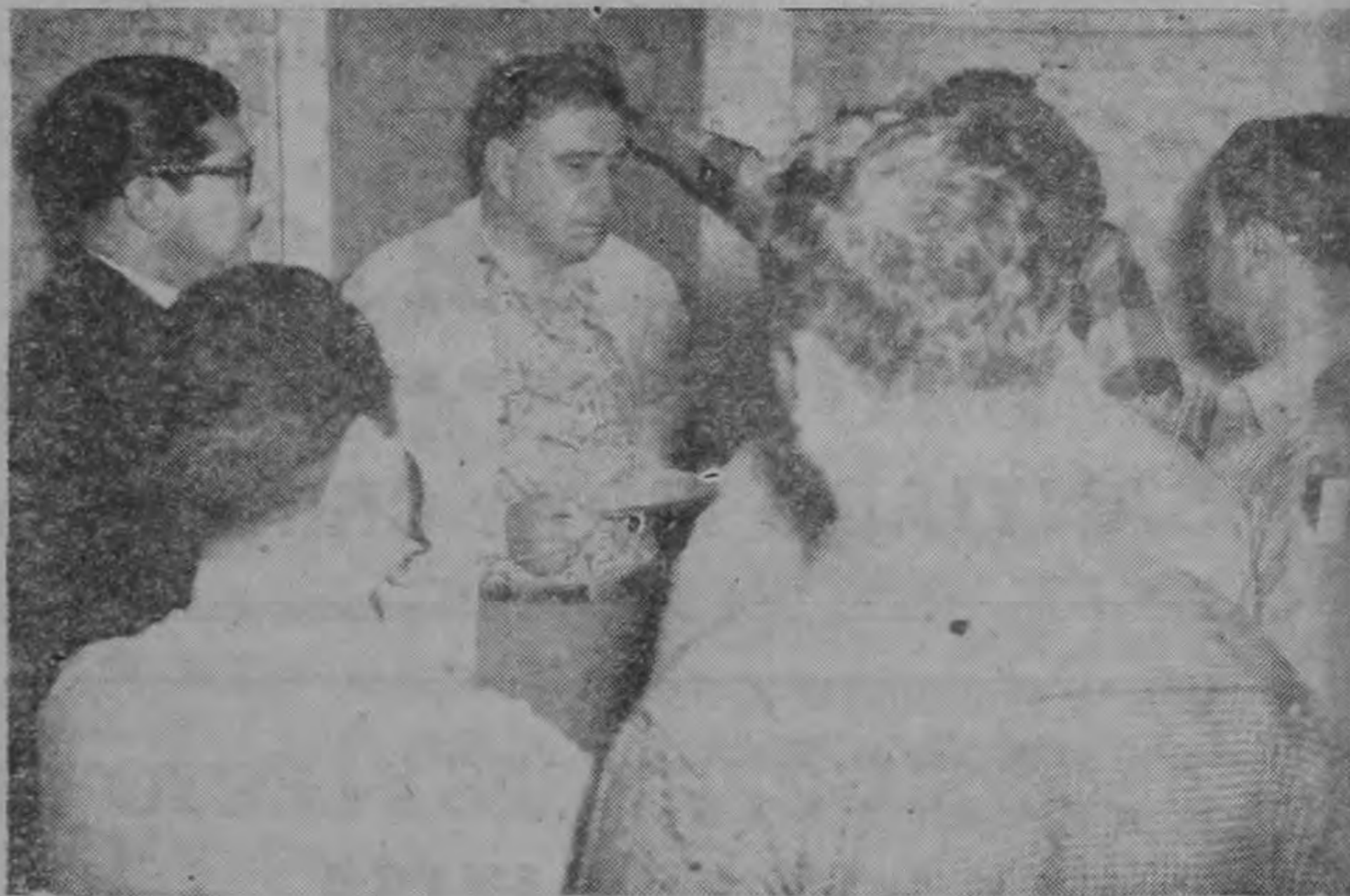
El señor Presidente de la República, don Otilio Ulate, en las oficinas de LACSA, en el aeropuerto de LA SABANA, a donde acudiera para informarse personalmente de los detalles del grave accidente aéreo de ayer.