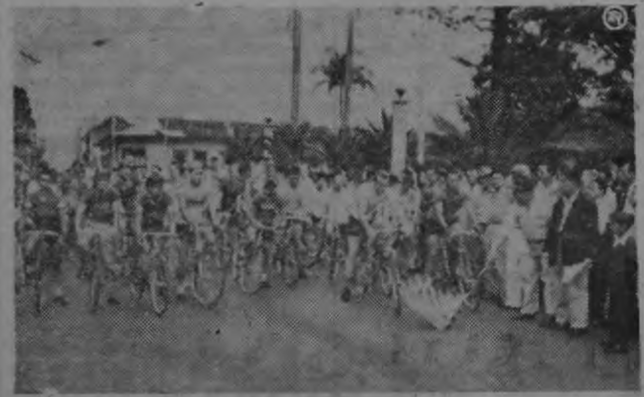
Salida de los ciclistas.