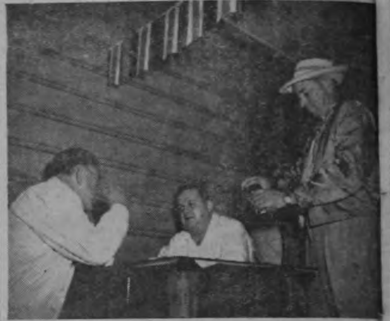
Los Presidentes de Costa Rica y Panamá se entrevistaron en forma casual en la frontera, a primeras horas de la tarde de ayer en Puerto González Víquez. En la foto, don Otilio Ulate y el Coronel José Antonio Remón, conversando animadamente.

SANTA FE, Nuevo México, 15.—(INS).—Guardias y policías fuertemente armados mataron hoy a dos penados al dominar a tiros un plante en el penal estatal de Nuevo México. Los guardias y policías atacaron un hospital de la prisión donde se habían hecho fuertes veinte penados que tenían nueve rehenes. Se hicieron más de doce disparos contra los presos que esta-