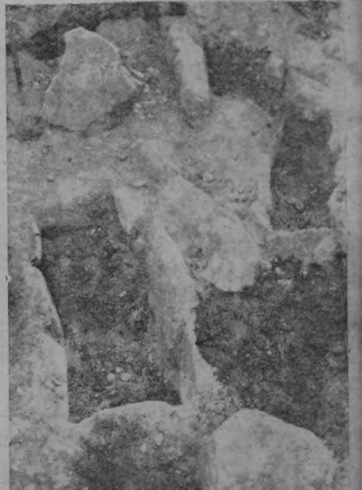
Dos de las tumbas encontradas bajo el patio del Colegio Vocacional de Artes y Oficios de Cartago.