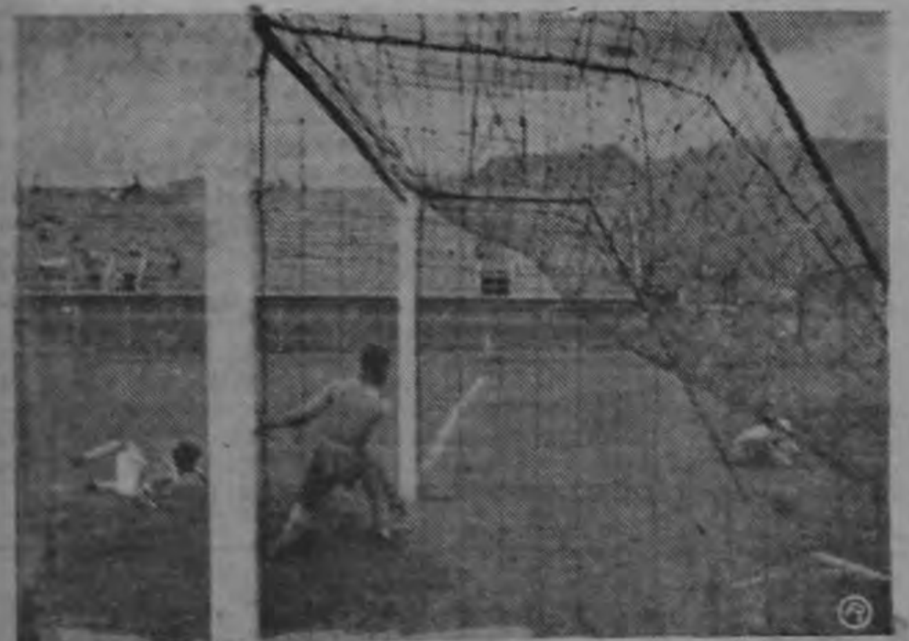
Empate de Moravia. Resultaron vanos los esfuerzos de Beckles por evitar la anotación.