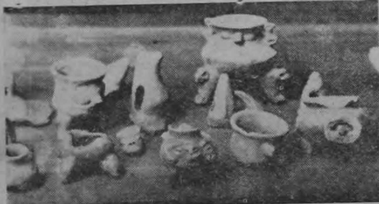
Algunos de los objetos extraídos de las excavaciones.