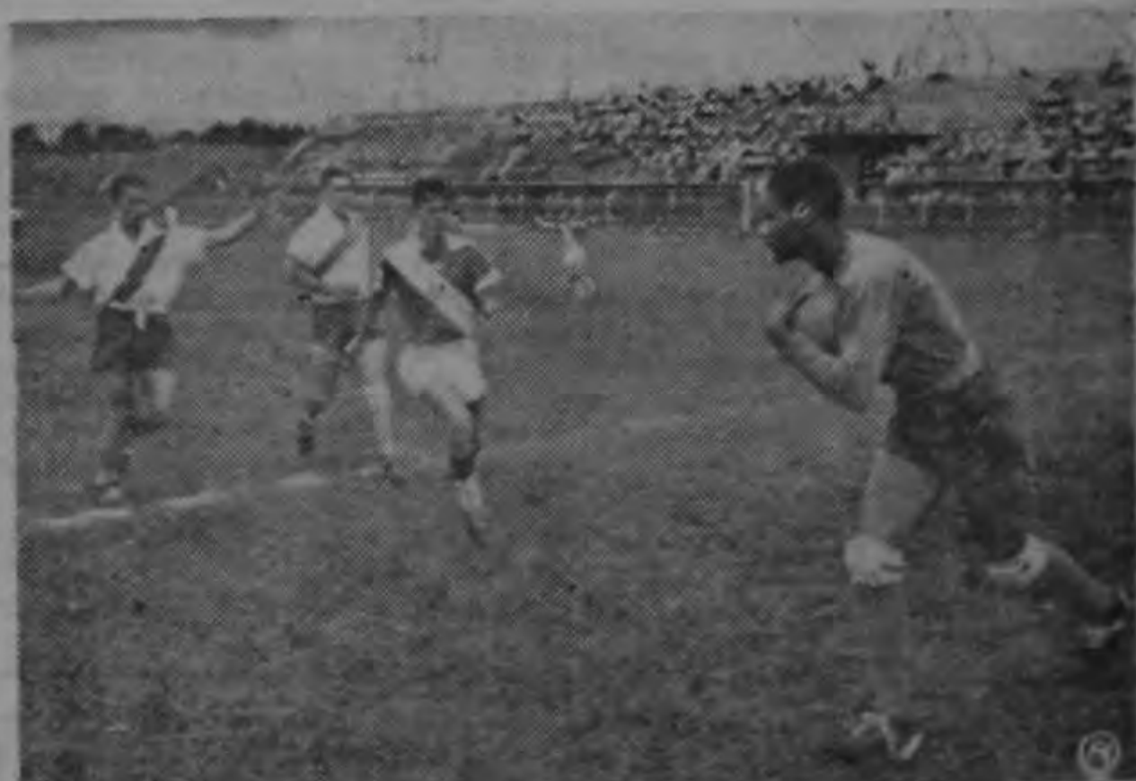
Beckles hace oportuna salida evitando así que remate Cordero de Moravia.